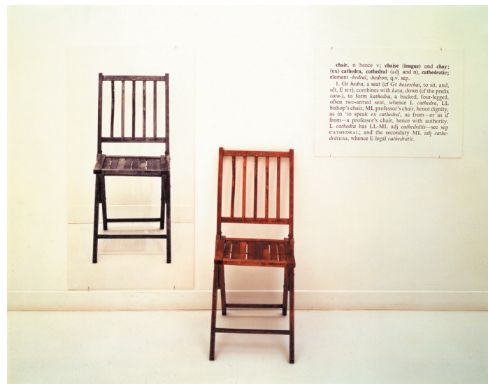
Joseph Kosuth, One and three chairs , 1965, Museum of Modern Art, New York

Villa Manin di Passariano, Codroipo (Udine)