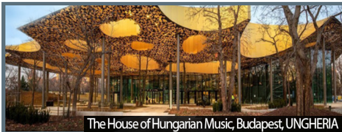
The House of Hungarian Music, Budapest, UNGHERIA